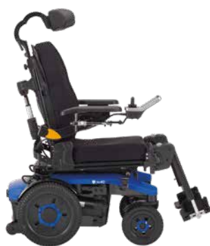
AVIVA RX 40 Modulte

Die Einstiegsvariante bietet eine hervorragende Mobilität im Innenraum und ist ideal für Nutzer mit einem weniger komplexen Versorgungsbedarf. Sie verfügt über eine einteilige Sitzplatte und ist optional mit teleskopierbarem Sitzrahmen erhältlich.