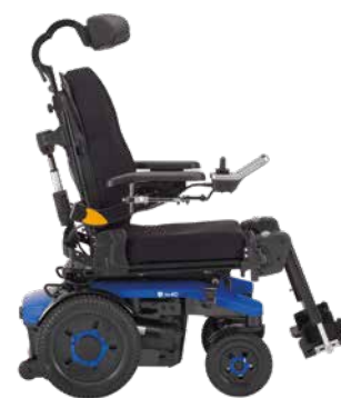
AVIVA RX 40 Modulte HD

Die ideale Lösung für alle, die ihren Rollstuhl gleichermaßen im Innen- und im Außenbereich verwenden und eine individuelle Unterstützung benötigen. Auch als Modell mit Sitzlifter erhältlich.