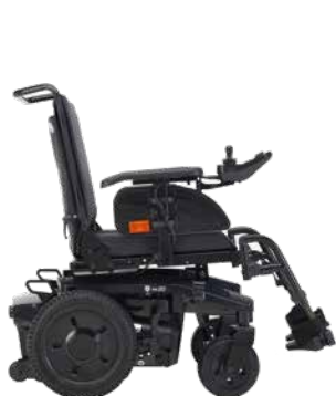
AVIVA RX 20 Modulte

Der richtige AVIVA für jeden Nutzer! Die AVIVA Elektro-Rollstühle lassen sich individuell ausstatten. Hier einige Beispiele: